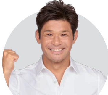
イクメンタレント | 照英さん